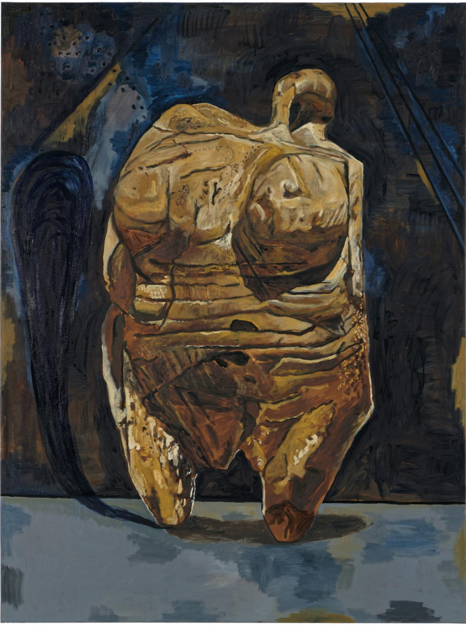
Damien Deroubaix, "Multi", 2018, 200 x 150 cm. Blaise Adilon/MAMC+Saint-Etienne/Courtesy Damien Deroubaix et galerie In Situ - fabienne leclerc, Grand Paris/Adagp, Paris, 2020.